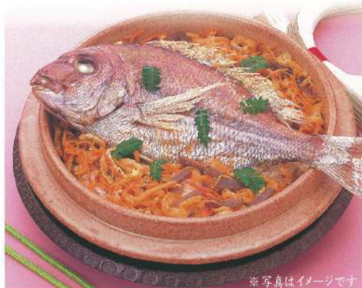
040 ■ 鯛釜飯 [3人前目安] 3,800円～