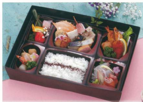
604 ■ お弁当 2,000円～2,500円