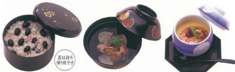
160 ■ 黒おこわ 800円 165 ■ 法要吸物 500円 170 ■ 法要茶碗蒸し 500円