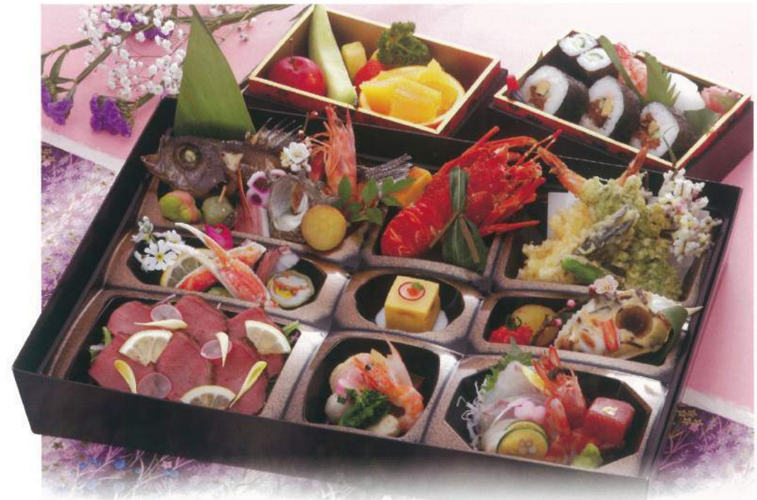
150 ■ 法要箱膳 8,000円 [使い捨て容器です]