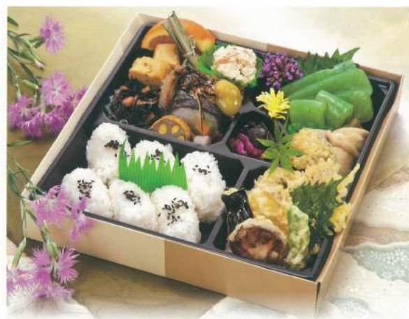
180 ■ 立飯 1,500円 [使い捨て容器です]