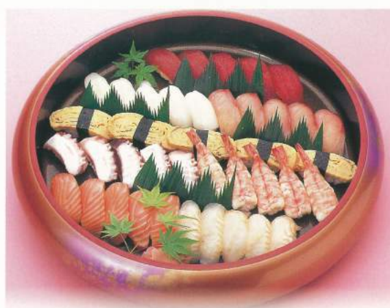
461 ■ にぎり [5人前] 5,000円