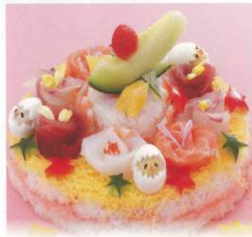
525 ■ ちらしケーキ 5,000円～[使い捨て容器]