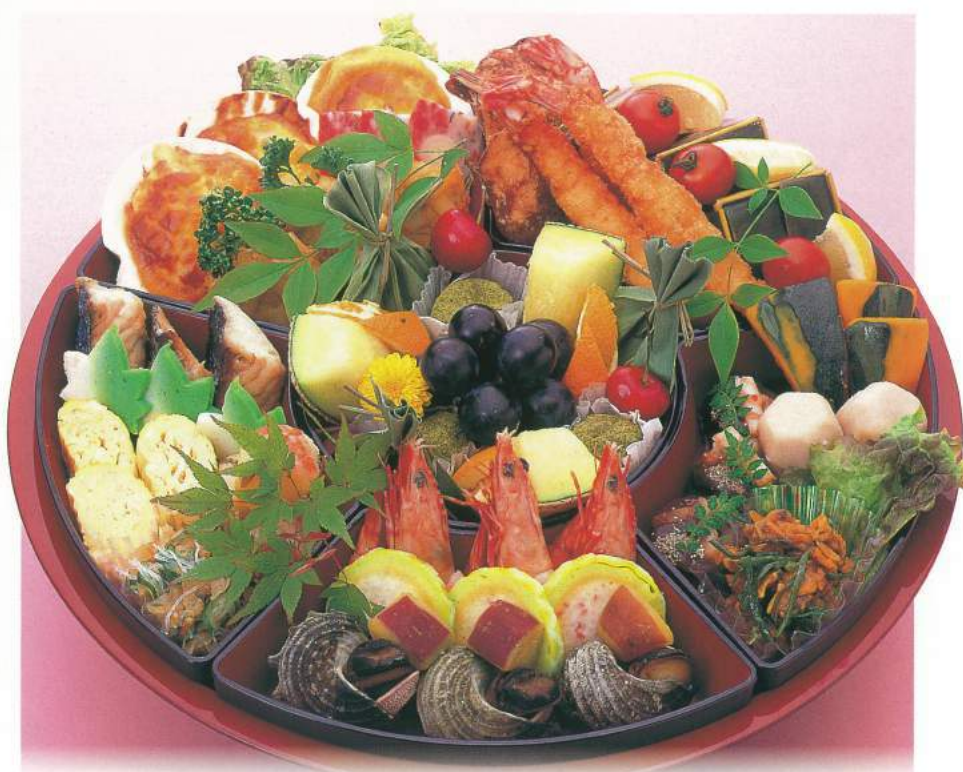
320 ■ オードブル [38cm] 8,000円

■ 季節・その日の仕入れにより、写真とは多少異なる場合がございます。■ グラス・徳利・壺・お膳を貸し出しいたします。