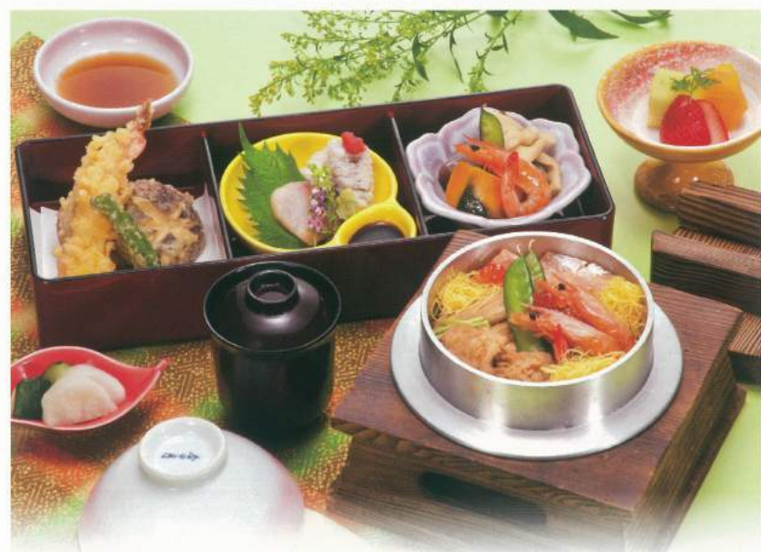
▲海鮮釜飯セット 2,500円