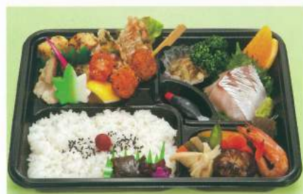
655 ■ お弁当 1,500円