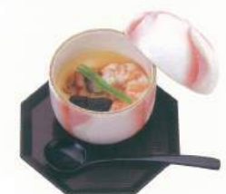
085 ■ 茶碗蒸し 500円