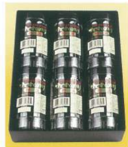
101 ■ 福山 浅草屋のり 2,400円 [写真の品] 2,000円から承ります。