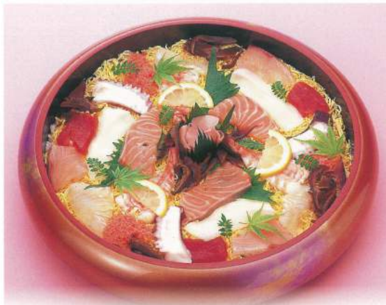
493 ■ ちらし [3人前] 3,000円 ▲写真の品