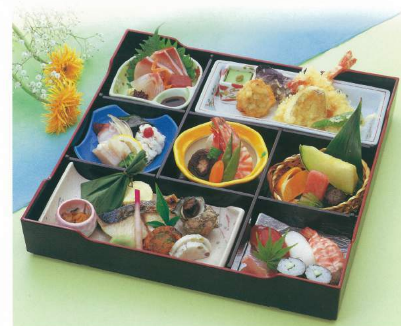
145 ■ 松花堂 [寿司入り] 4,500円 147 ■ 松花堂 [白御飯] 4,000円