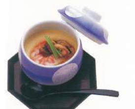
170 ■ 法要茶碗蒸し 500円