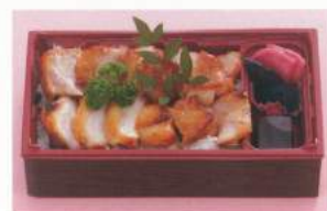
640 ■ 鶏の西京井弁当 1,200円