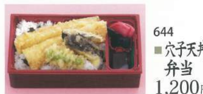
644 ■ 穴子天丼弁当 1,200円