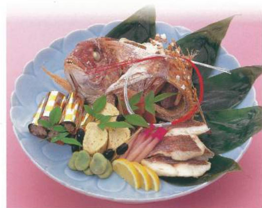
045 ■ 鯛姿焼 [約1kg] 5,800円～