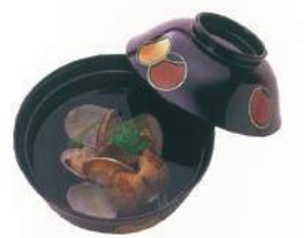
165 ■ 法要吸物 500円