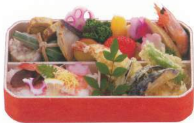
▲写真は1,800円 606 ■ 木箱のお弁当 1,500円～