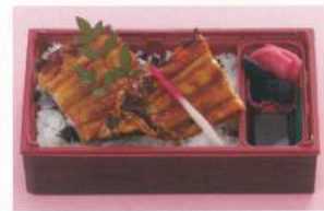
642 ■ うなぎ 2,500円 643 ■ 上うなぎ 3,800円