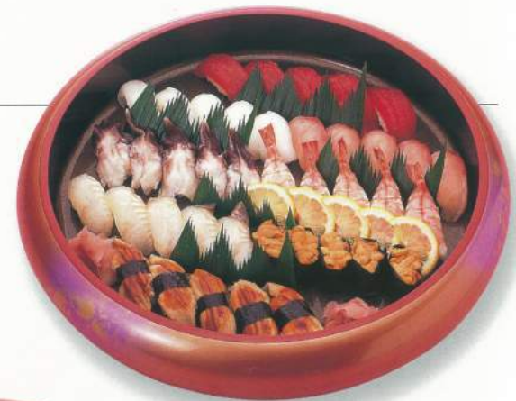
461 ■ にぎり [5人前] 5,000円 ▲写真の品