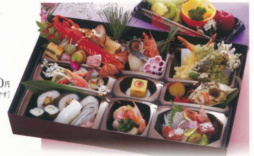
152 ■ 法要箱膳 7,000円 [使い捨て容器です]