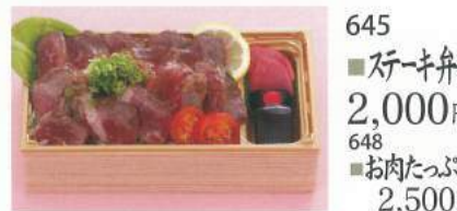
645 ■ ステーキ弁当 2,000円 648 ■ お肉たっぷり 2,500円