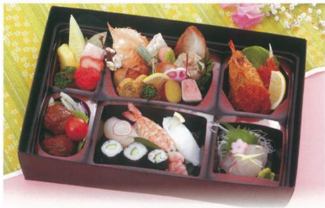
158 ■ 子供パック 2,000円 [使い捨て容器です] 1,000円 1,500円