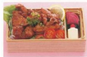
641 ■ 鶏ステーキ弁当 1,200円