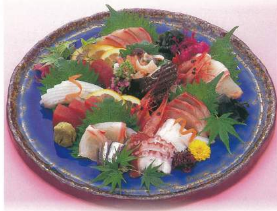
355 ■ 上平盛り 6,000円