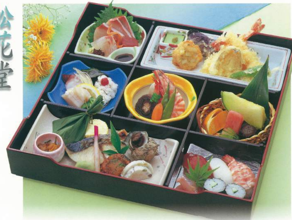
145 ■ 松花堂 [寿司入り] 4,500円 147 ■ 松花堂 [白御飯] 4,000円 ■ ご予算に応じ承ります。