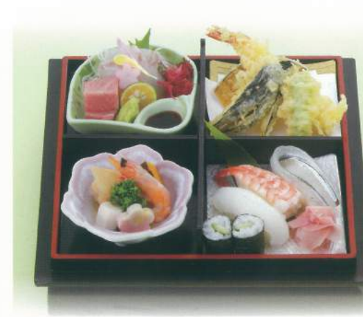
590 ■ 松花堂 [寿司入り] 2,000円 595 ■ 松花堂 [白御飯] 1,500円