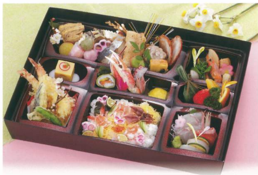
602 ■ お弁当 3,000円～3,500円