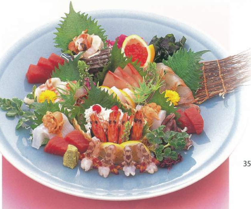
350 ■ 特上平盛り 10,000円