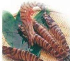
▲写真はイメージです