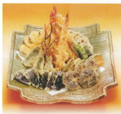
250 ■ 天ぷら 3,000円