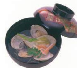
080 ■ 吸物 500円