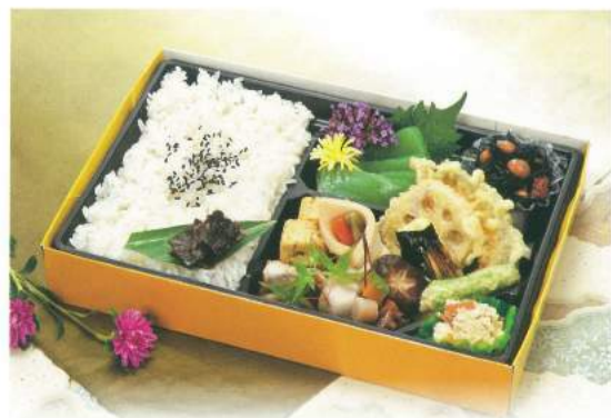
185 ■ 立飯 1,000円 [使い捨て容器です]