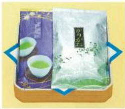
204 ■ お茶 1,500円 2,000円