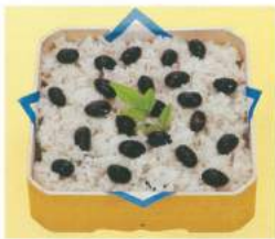
196 ■ 黒おこわ折詰 1,500円