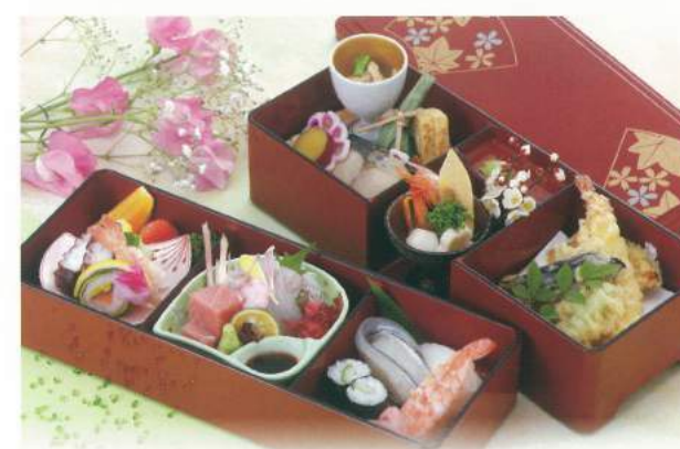
550 ■ 瀬戸内弁当 [寿司入り] 3,300円 555 ■ 瀬戸内弁当 [白御飯] 2,800円