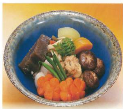
255 ■ 炊き合わせ 3,000円

あわただしい中、 ご弔問いただいた方々へ お礼を込めた、 こころばかりのお持てなし料理です。