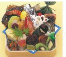
194 ■ おかず上折 2,800円