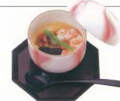
085 ■ 茶碗蒸し 500円