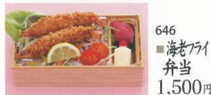
646 ■ 海老フライ弁当 1,500円