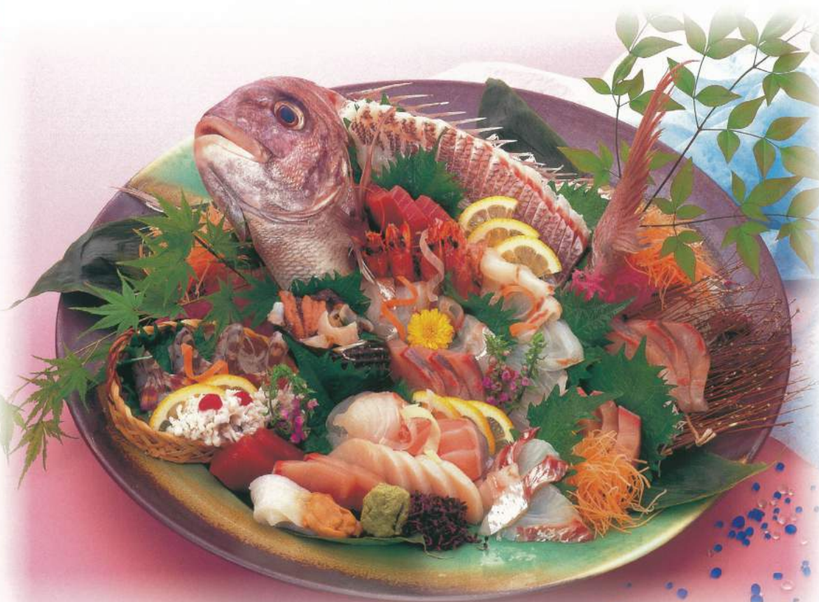
060 ■ 天然鯛活造り [5人前] 15,000円

天然鯛の甘みと旨み。艶やかな脂ものつた食感。鯛ならではの味です。ぜひ、ご堪能ください。