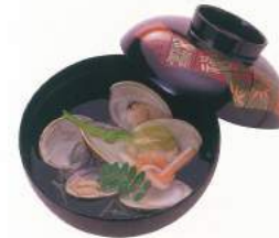
080 ■ 吸物 500円