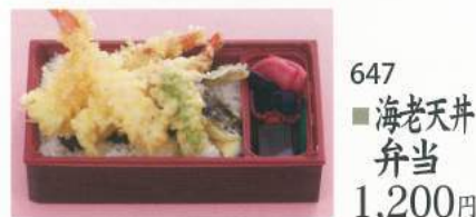
647 ■ 海老天丼弁当 1,200円