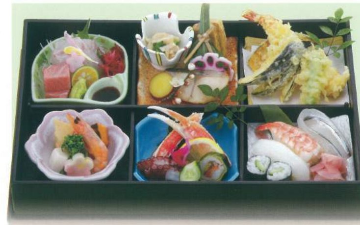
580 ■ 松花堂 [寿司入り] 3,000円 585 ■ 松花堂 [白御飯] 2,500円