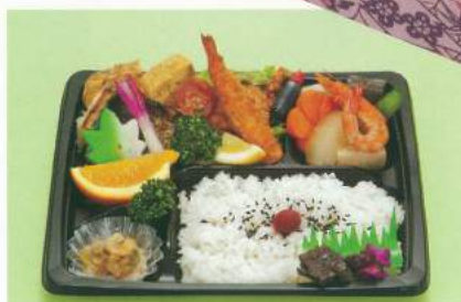
660 ■ お弁当 1,000円