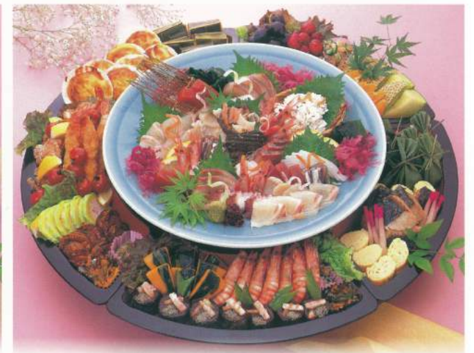
300 ■ 刺身入りオードブル [68cm・7人前] 25,000円