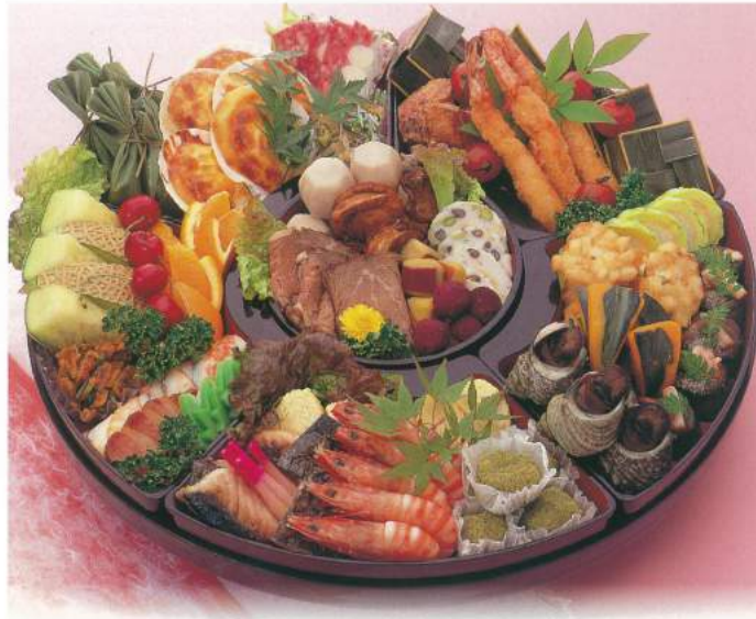
315 ■ オードブル [46.5cm・5人前] 12,000円

■「オードブル」は、1人前2,000円・2,500円・3,000円の人数盛りにてご利用いただいています。