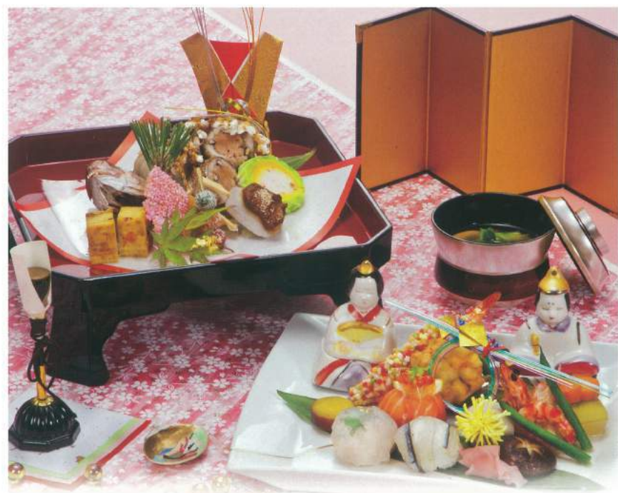
030 ■ 節句膳 4,800円