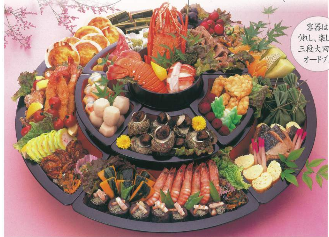
305 ■ オードブル [68cm・7人前] 20,000円