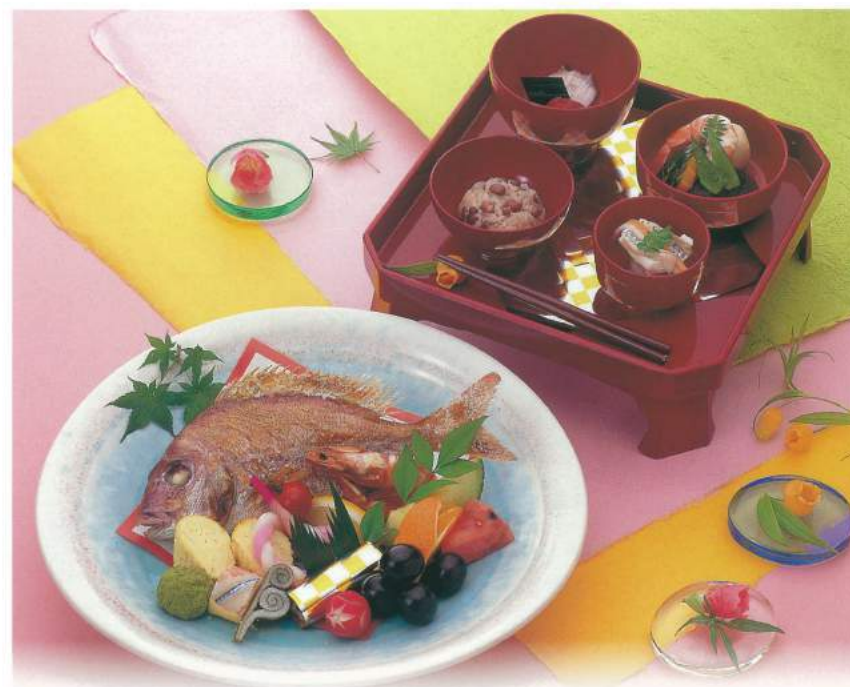
032 ■ 百日膳 3,800円

お食い初め：生後百日目に、食べ物に困らないようにと願いをこめる儀式です。双方の両親を招いて祝膳でもてなすことも多いようです。