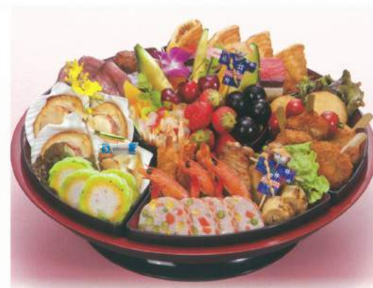
325 ■ お子様オードブル 5,000円