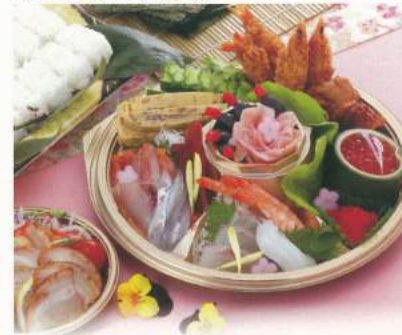
520 ■ ファミリー手巻きセット 5,000円～[使い捨て容器] (すしネタ・シャリ玉・のり)