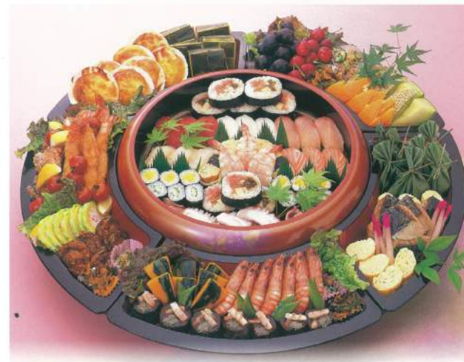
310 ■ 寿司入りオードブル [68cm・7人前] 18,000円