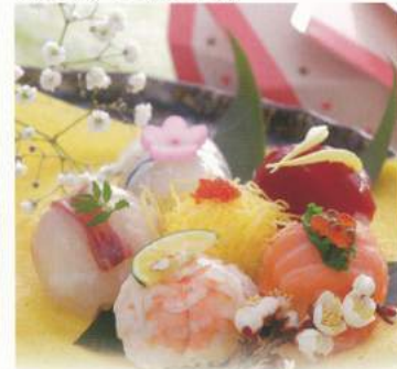
528 ■ 手まりずし(6個入) 850円[使い捨て容器] ご希望の個数でご用意致します。