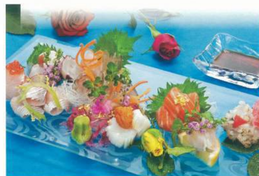
■ おまかせ刺身盛合せ