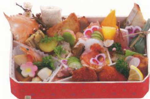
▲写真は2,500円 603 ■ 木箱のお弁当 2,000円～