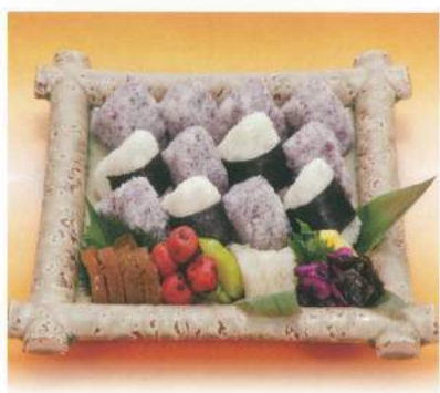
265 ■ おにぎり [1個] 250円 (お漬物付)