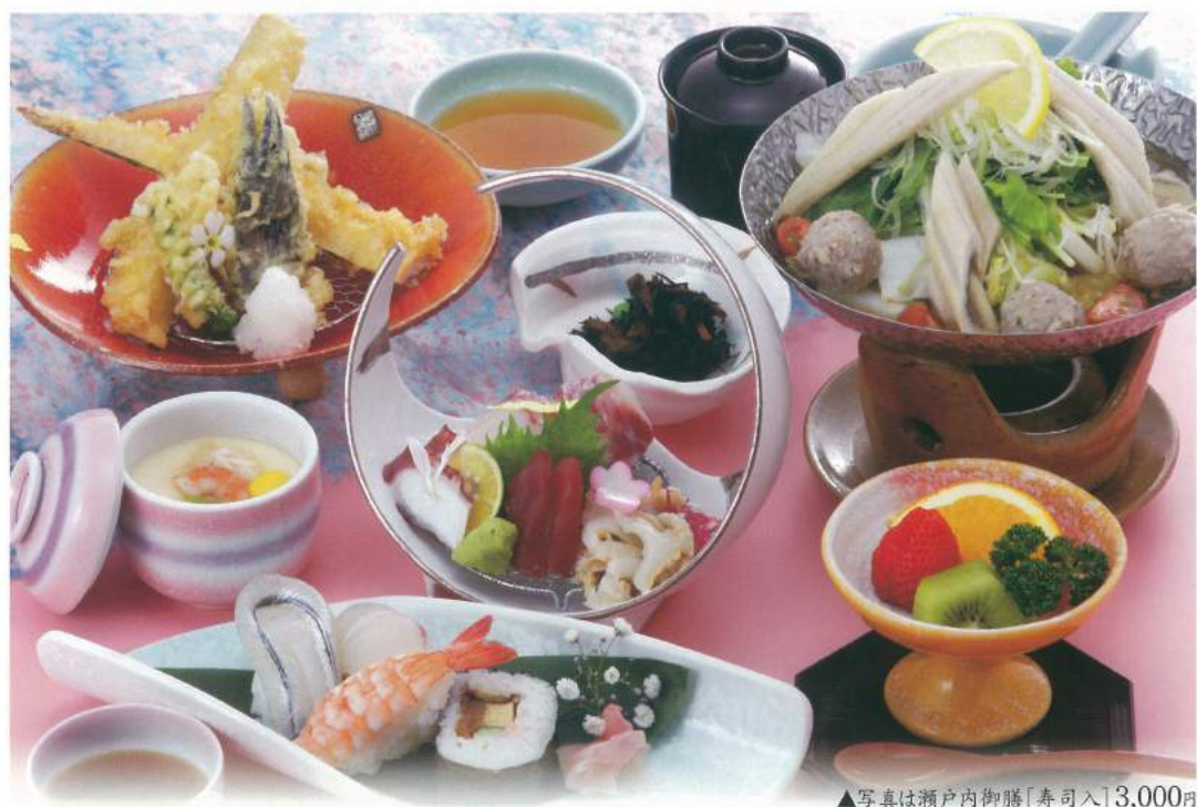
▲写真は瀬戸内御膳[寿司入] 3,000円