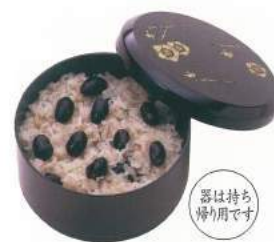
160 ■ 黒おこわ 800円