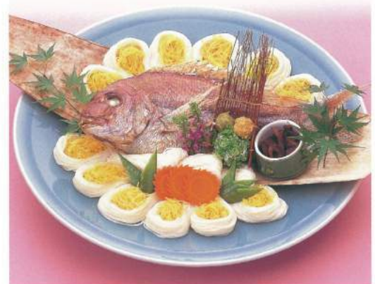
050 ■ 鯛素麺 [3人前目安] 3,800円～