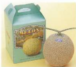
190 ■ メロン 1玉 2,500円 1玉 3,500円(静岡県産)