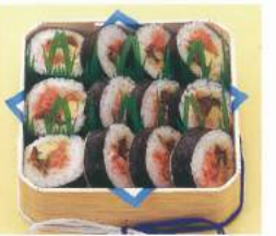
198 ■ 巻物折詰 1,500円