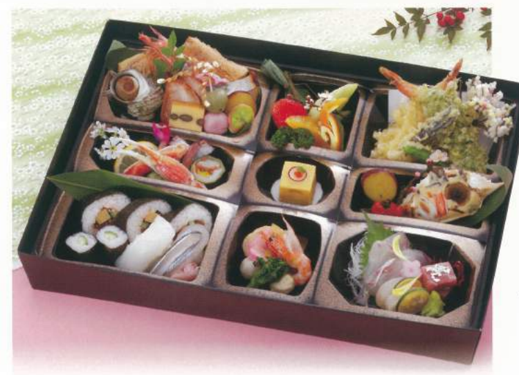
154 ■ 法要箱膳 5,000円 [使い捨て容器です]