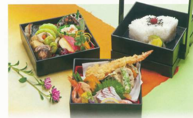
560 ■ 野立て三段 [白御飯] 2,000円 565 ■ 野立て三段 [寿司入り] 2,500円