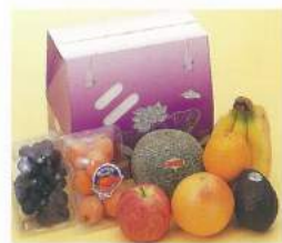
192 ■ 果物ボックス 2,500円・3,000円 3,500円