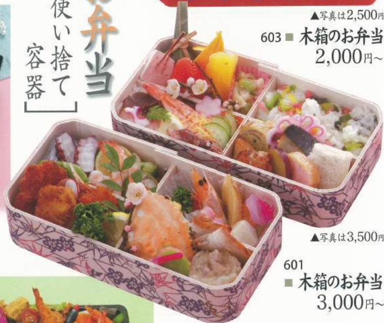
▲写真は3,500円 601 ■ 木箱のお弁当 3,000円～