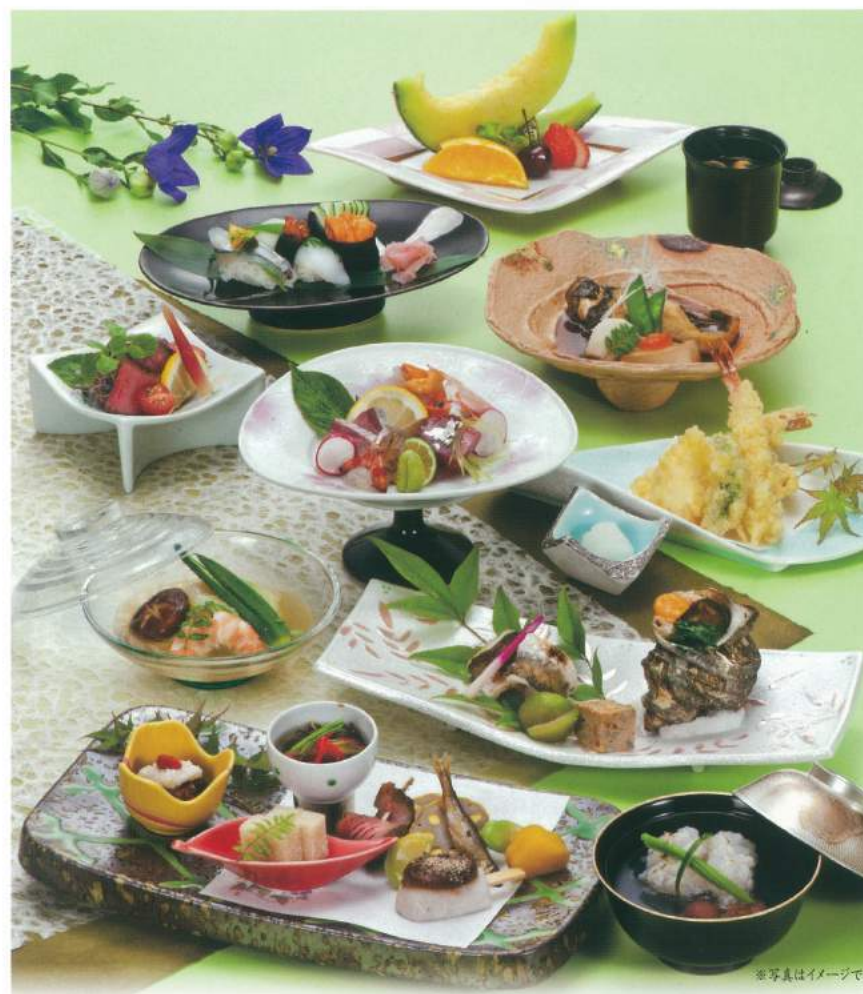
140 ■ 法要会席 8,000円

■ 季節・その日の仕入れにより、写真とは多少異なる場合がございます。■ グラス・徳利・壺・お膳を貸し出しいたします。